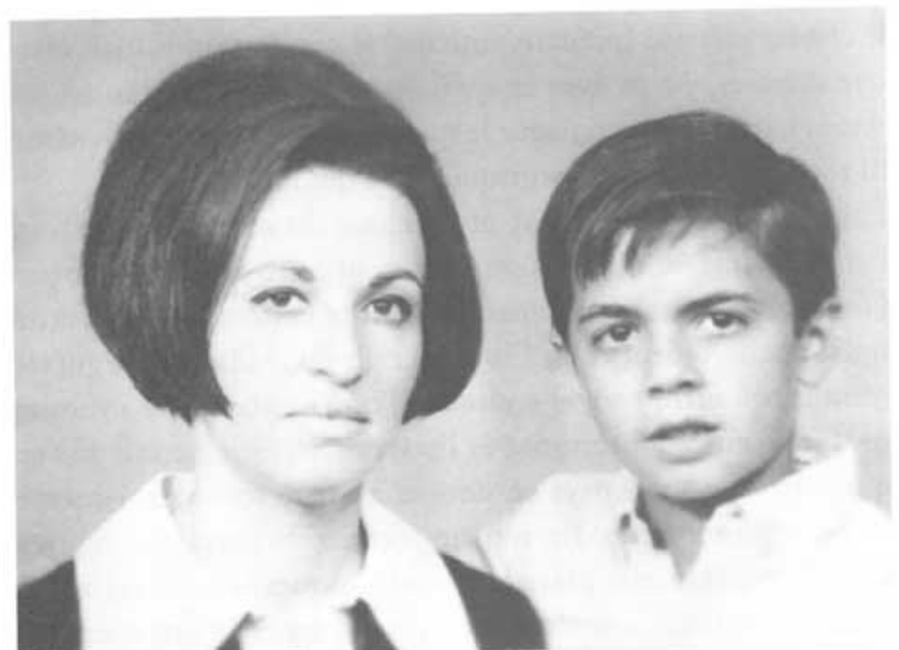
Mother and Son, 1958