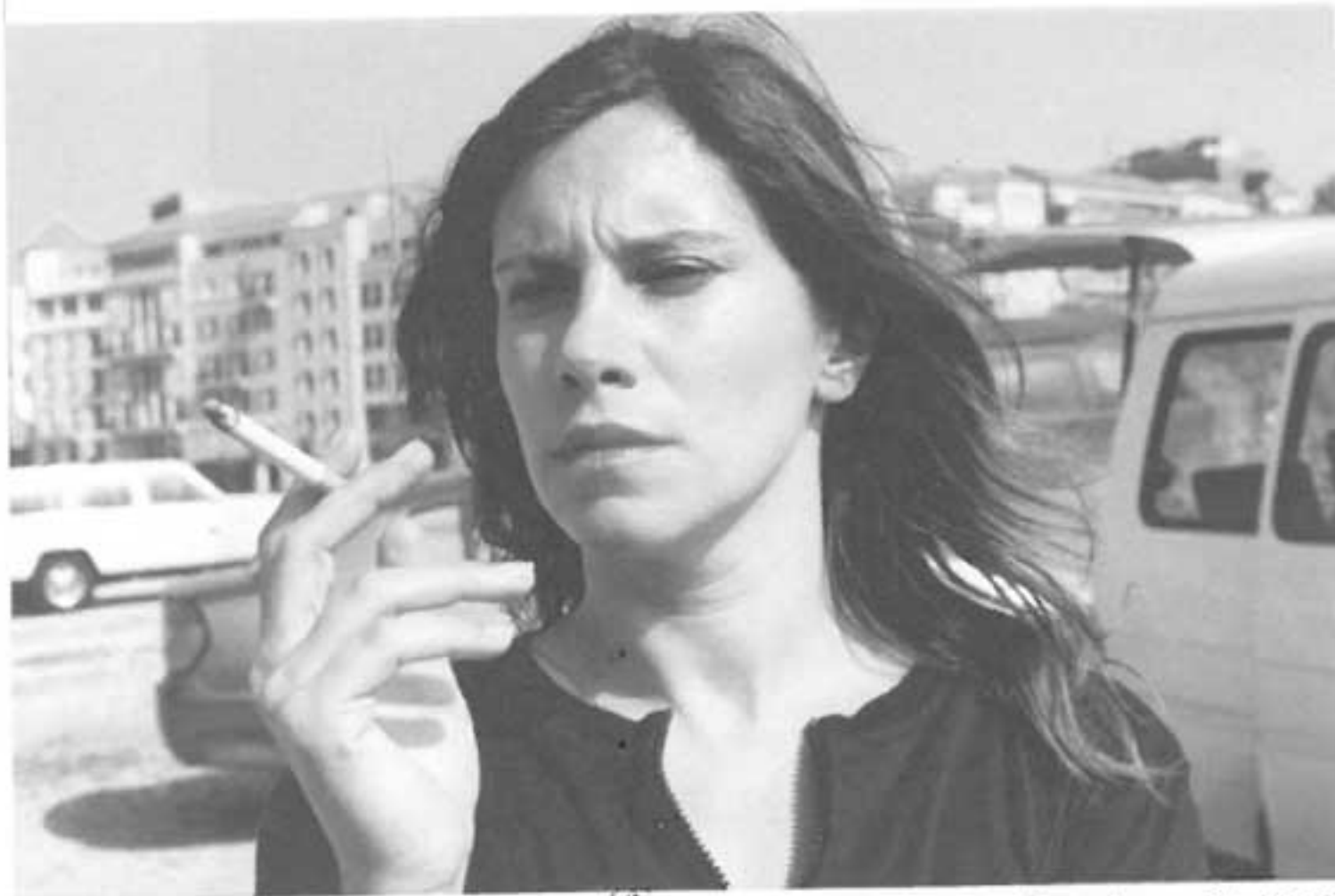
Terra incognita, 2002

de Beyrouth. Puisque « un chant meurt au moment même de sa naissance », mais que « nous aimons bien croire aux fantômes » ( Afrique fantôme ), le chant, agent de suspension temporelle et d'autonomisation de tranches de durée, véhicule le temps endeuillé de la catastrophe.