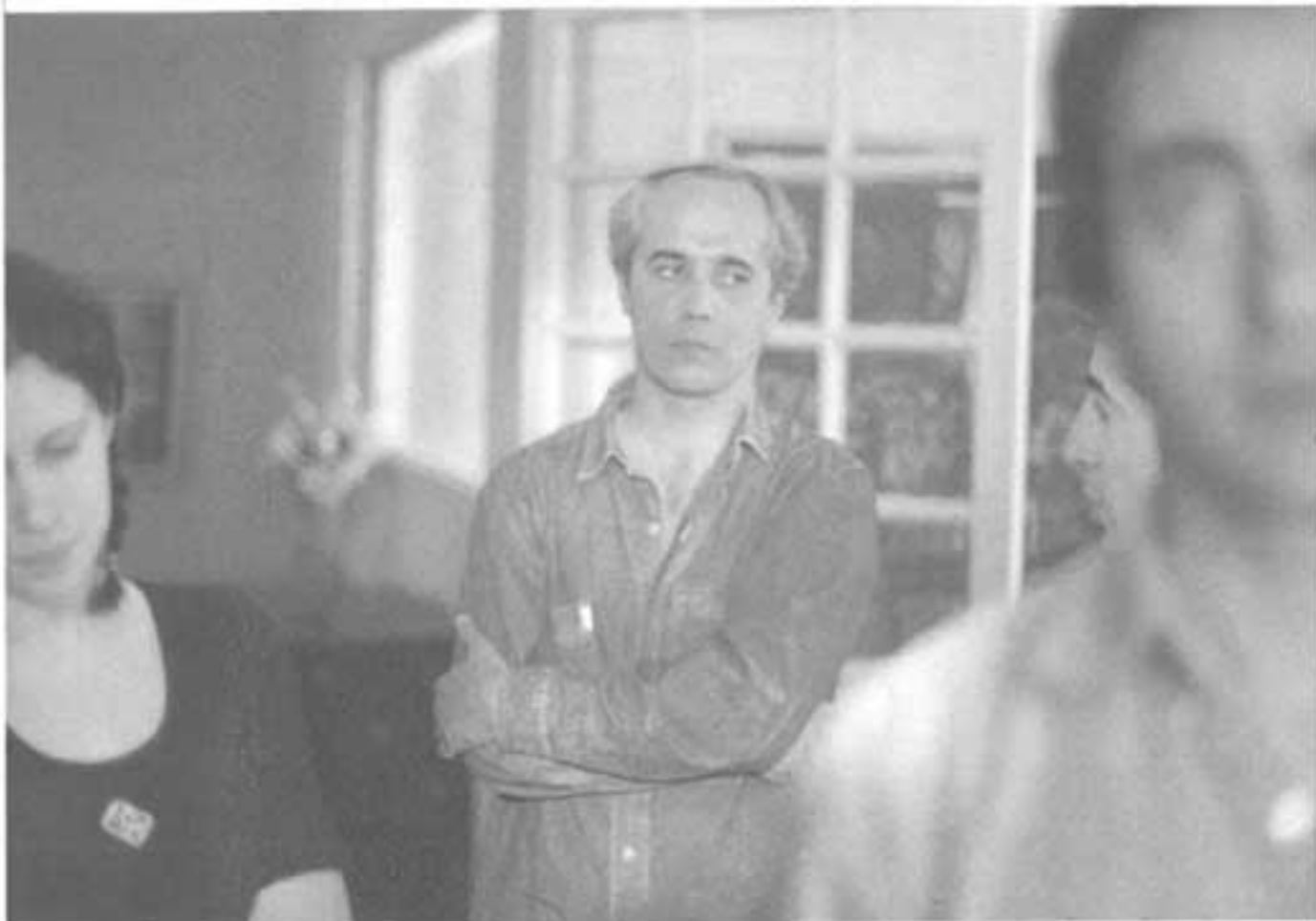
Beyrouth fantôme, 1998