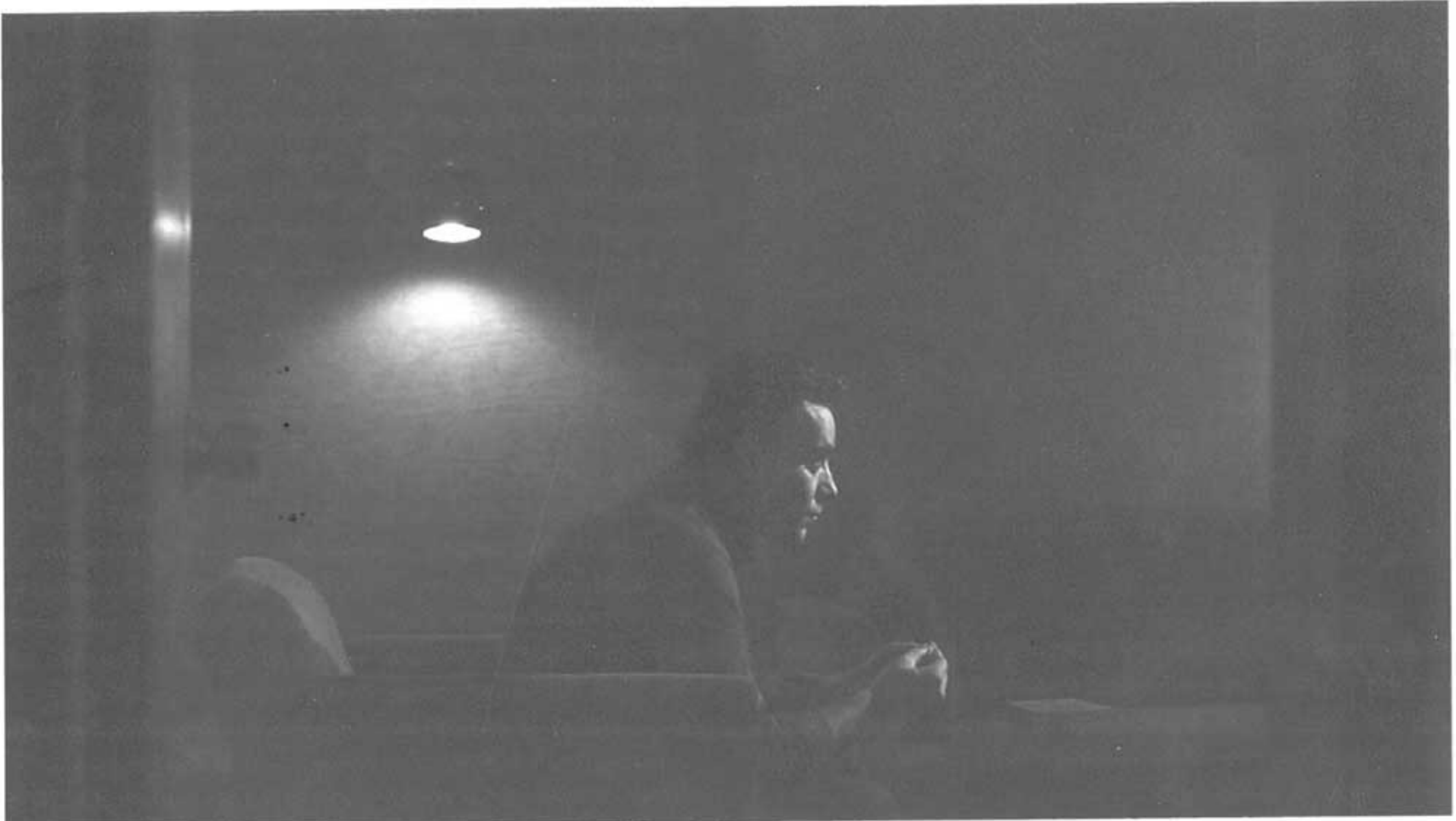
La Montagne, 2010

projets des dieux concurrents – les unes dans les autres ( La Rose de personne , 2000 ; Terra incognita , 2002 ; Posthume ). Comment savoir alors, passant outre à ce qu'en conte les musées, l'âge du monde ? Jeune ? vieux ? Le dialogue avec la culture africaine qu'initie Afrique fantôme (1994), en plus d'ouvrir un dialogue entre la mémoire individuelle (le cinéaste est né à Dakar) et la mémoire historique, interroge la saison du monde.